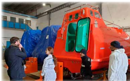
GEPA livbåt klar til levering.