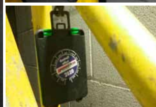
Kranene lever et tøft liv i varme omgivelser. «Koffert-skilt» identifiserer og tydeliggjør trapper og repos sin status.

KIS SØR AS avd. Telemark har tegnet ny KIS Avtale med Eramet Norway AS avd. Porsgrunn. Avtalen ble opprinnelig inngått i 2010 med forebyggende vedlikehold som hovedoppgave.