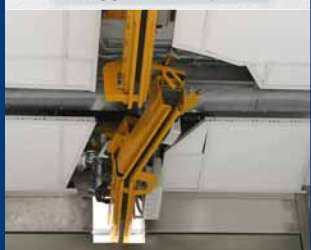
Pens til branddører.