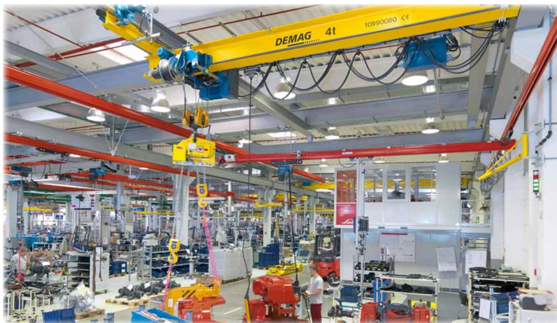
Tilsvarende kran som levert, Demag EPDE, underhengende traverskran.