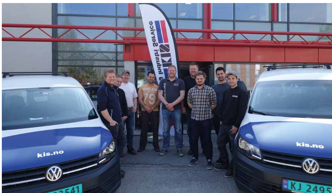
Ni fornøyde nyansatte fra KIS ØST AS på spesialtilpasset kurs på KIS Skolen i Asker.

Da KIS Skolen ble forespurt om å lage et spesialtilpasset kursopplegg for ni nyansatte i KIS ØST AS, tok vi utfordringen på strak arm. I løpet av mai hadde vi alle de nyansatte på 11 kursdager i KIS Skolen.