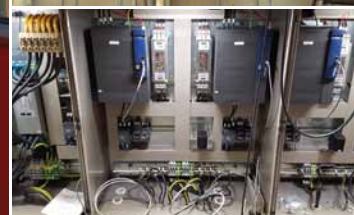
Bilde 1: Nye løpekatter på plass. Bilde 2: Kran før modernisering. Bilde 3: Nye el. skap under testing på verkstedet.