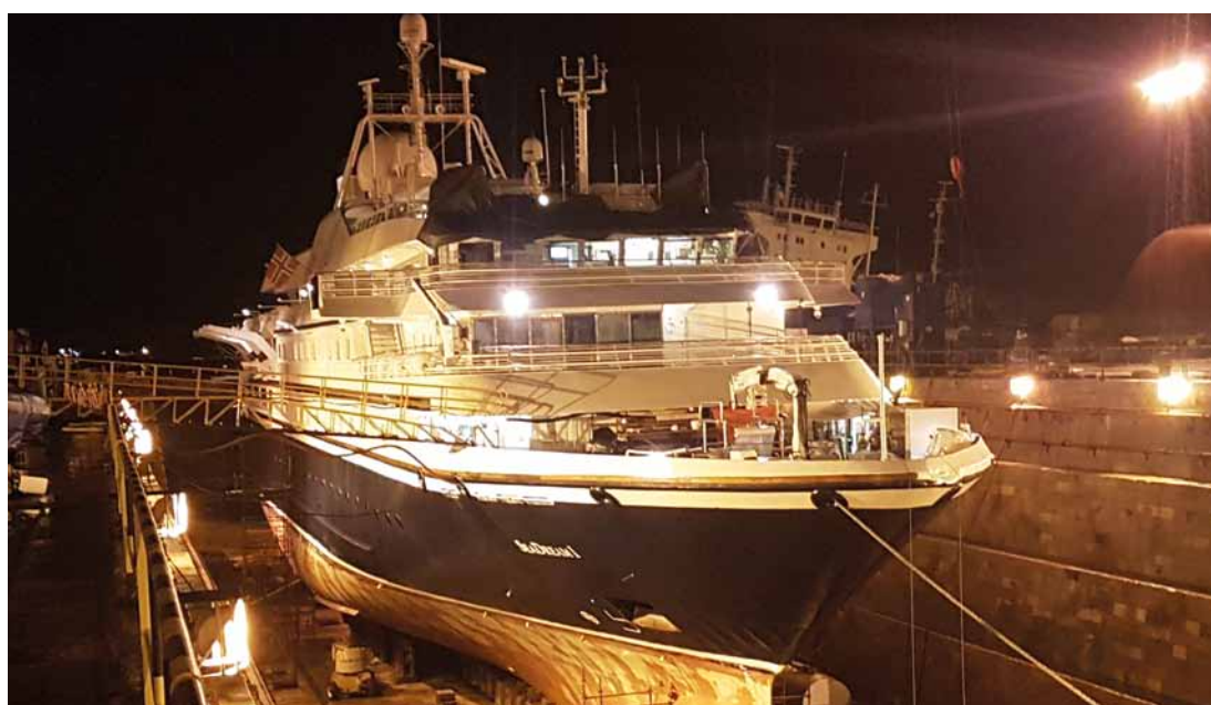
SeaDream 1, by night.

KIS MARITIME AS har nylig utført 5-års kontroll for SeaDream Yacht Club på en av deres to luksus yachter, SeaDream 1.